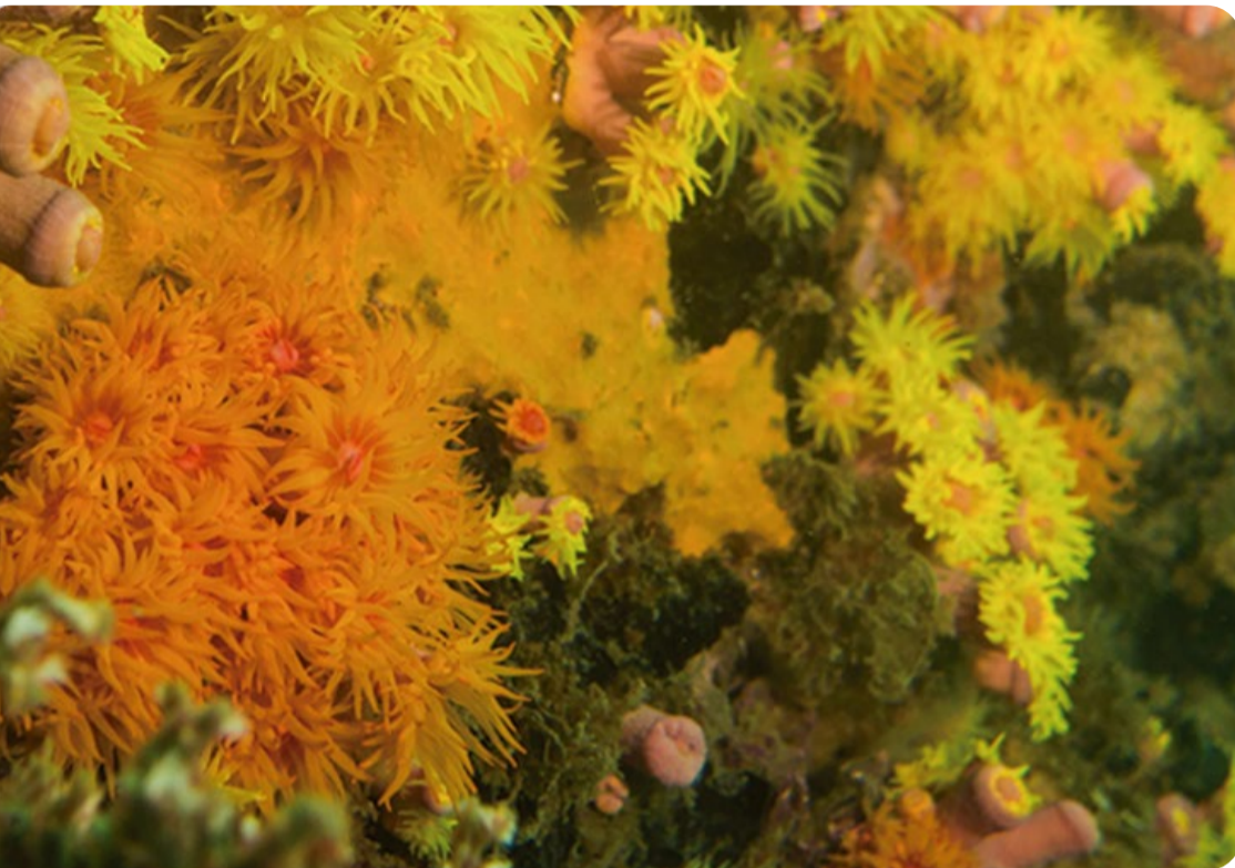
Coral-sol ( Tubastrea spp.)

soras é uma prioridade estabelecida pela Estratégia Nacional para Espécies Exóticas Invasoras, coordenada pelo Ministério do Meio Ambiente (MMA). Desta forma, o Departamento de Espécies do MMA preparou uma lista de potenciais fontes de financiamento para ações relativas às espécies exóticas invasoras, com base no produto Estudo sobre Sustentabilidade Financeira de Planos de Ação Territoriais, desenvolvido pelo Projeto GEF Pró-Espécies: Todos contra