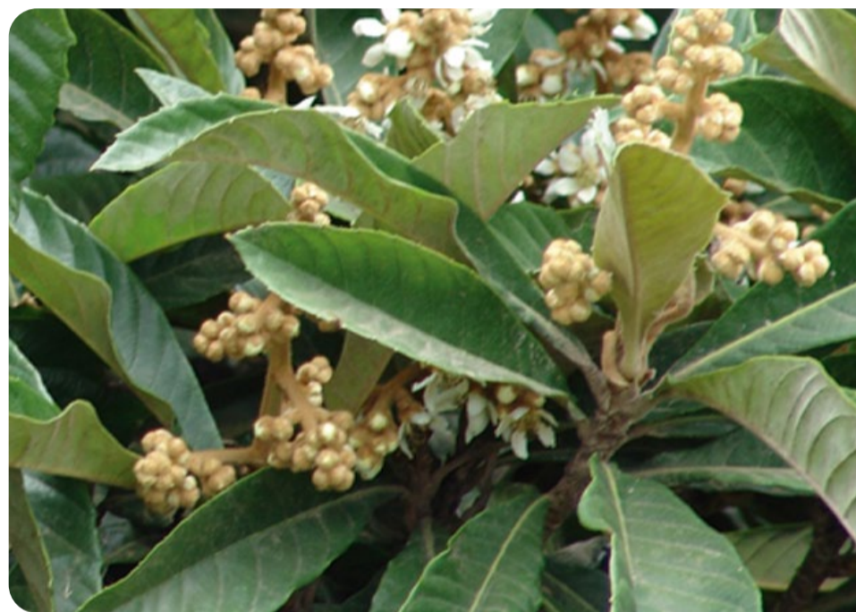
Nêspera ( Eryobotrya japonica )

Em virtude do potencial invasor e capacidade de excluir as espécies nativas, diretamente ou pela competição por recursos, as espécies exóticas invasoras podem transformar a estrutura e a composição dos ecossistemas, homogeneizando os ambientes e destruindo as características peculiares que a biodiversidade local proporciona. Por esse motivo, estão entre as principais causas diretas de perda de biodiversidade e extinção de espécies, juntamente com mudanças climáticas e perda de habitat, sobre-exploração e poluição, fatores com os quais podem ter efeitos negativos sinérgicos.