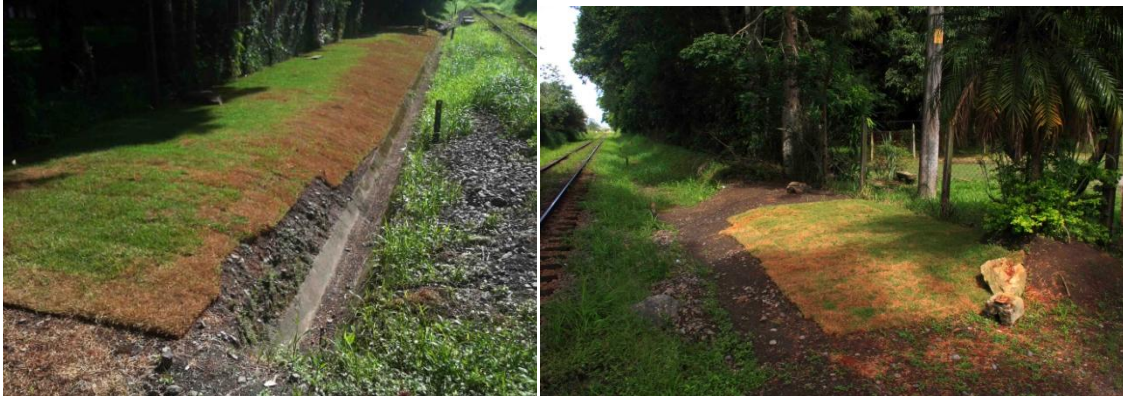
Colocação de grama na frente da Flona