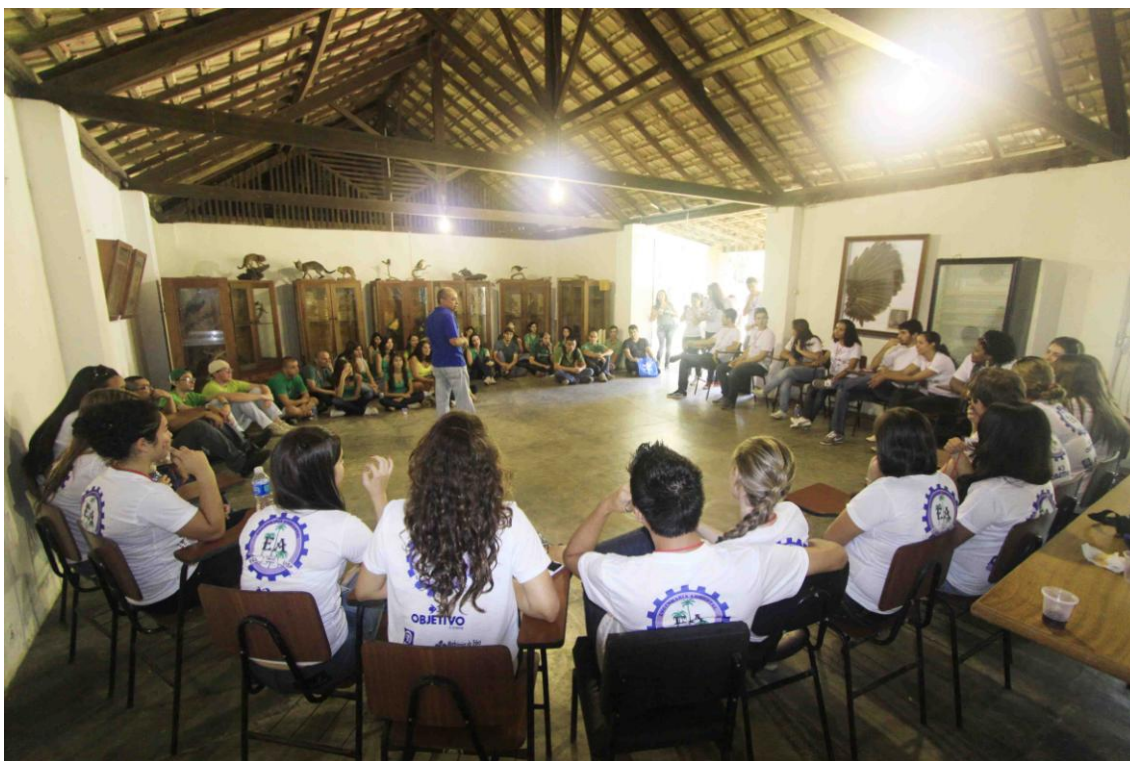
5. “2º Café na Floresta”.Evento de abertura do Curso de Engenharia Ambiental da USP