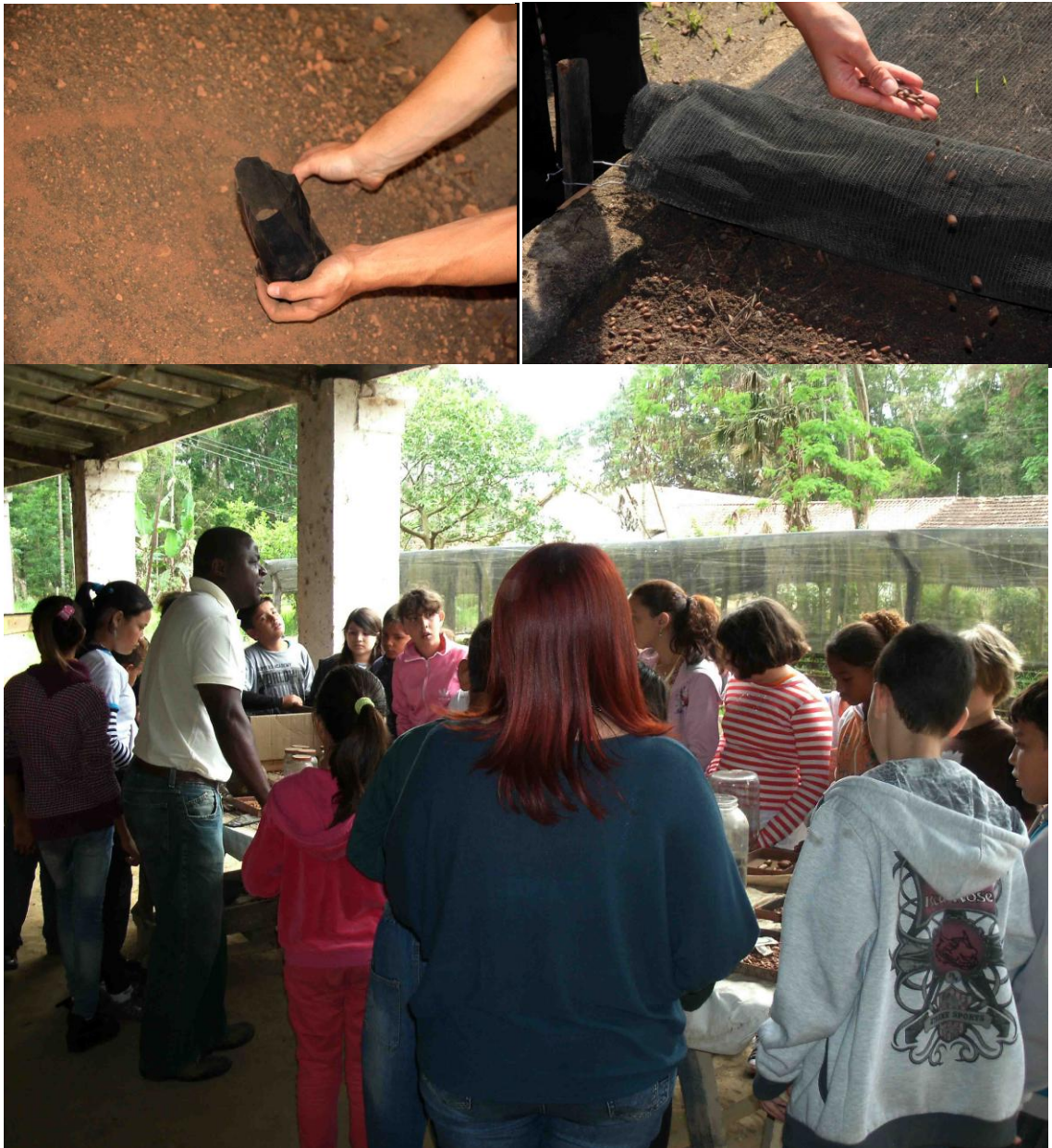
Visitas pedagógicas ao viveiro da Flona com escolas municipais de Lorena.