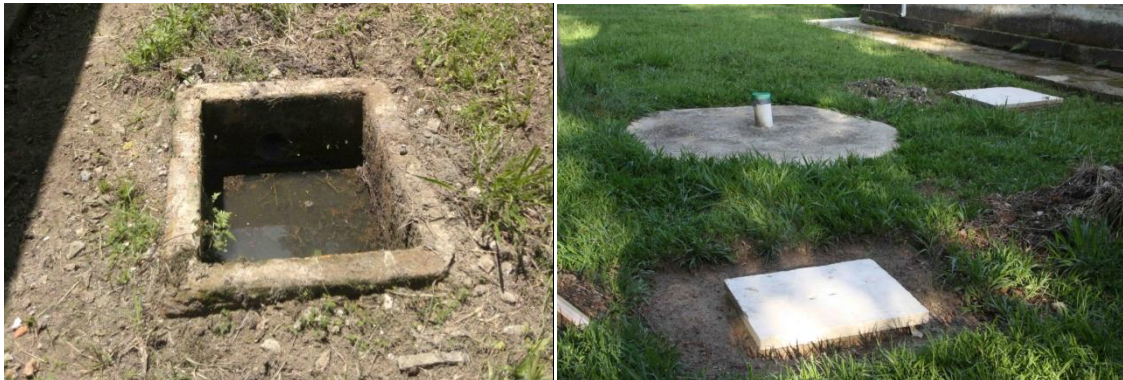
Fechamento das tampas de esgoto(2011).