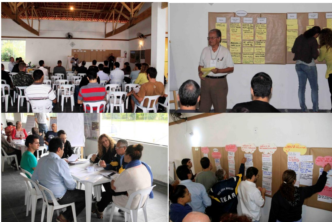
Atividades dos participantes da Oficina de Planejamento Participativo-OPP

Durante três dias foram apresentados o diagnóstico, a proposta de zoneamento interno da Flona, os Programas de implantação da unidade, as contribuições dos presentes sobre avaliação estratégica da unidade (pontos fortes, pontos fracos, ameaças e oportunidades para a unidade), aprovação da missão e visão de futuro da Flona e em grupos de trabalho foram discutidos e aprovados o planejamento da unidade, além da apresentação de uma proposta da Zona de Amortecimento da Flona. Participaram 49 (quarenta e nove) pessoas, incluindo servidores da Flona, do ICMBio de Brasília, conselheiros, comunidade, universitários e professores.