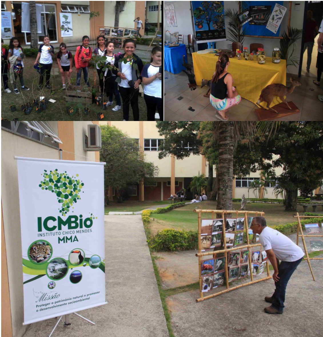
4. Dia Nacional do Biólogo. Evento realizado na FATEA-Faculdades Integradas Teresa D'Ávila.