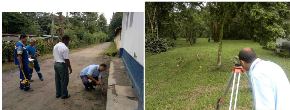
Levantamentos de campo iniciais da SABESP e elaboração de projeto preliminar de Sistema de Saneamento Básico da Flona de Lorena(2012).