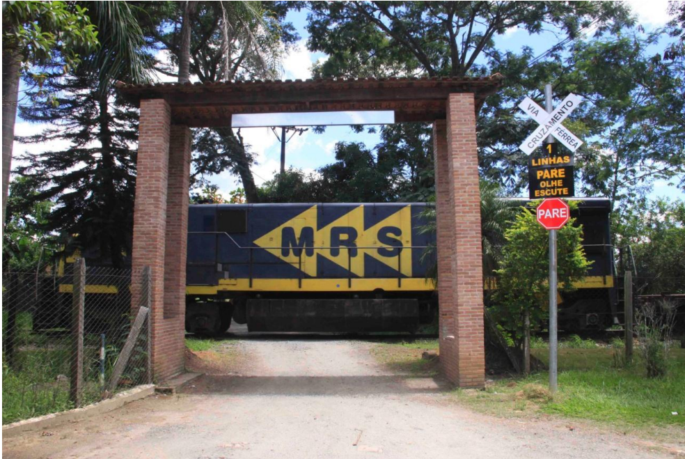
Colocação de novas placas de sinalização da rede férrea