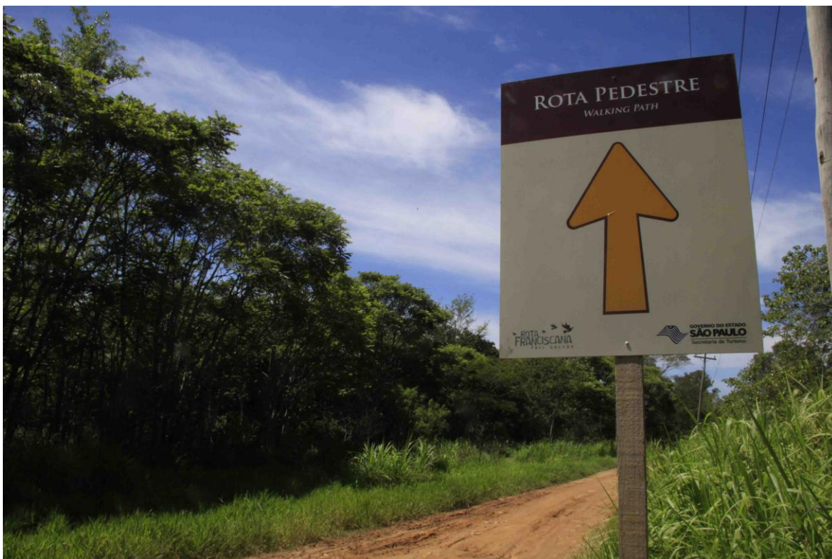
Placa de sinalização da Rota Franciscana colocada na estrada que cruza a Flona de Lorena.

Entendimentos com autoridades da Secretaria de Turismo do Estado de São Paulo no sentido de integrar ações que garantam o sucesso da Rota Franciscana (Programa Caminha São Paulo) que passa no interior da FLONA de Lorena.