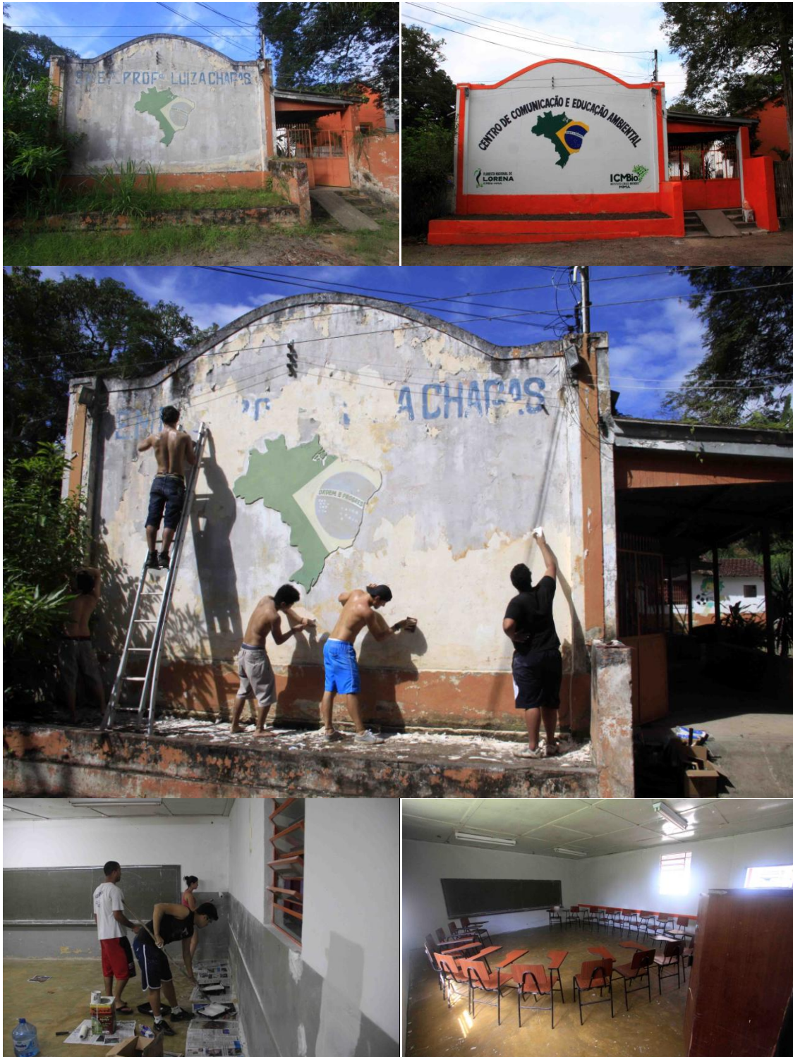
Limpeza, melhoramento básico da antiga escola e projeto da Sala Verde realizado pelo Grupo de Voluntários “O Despertar do Gigante”.