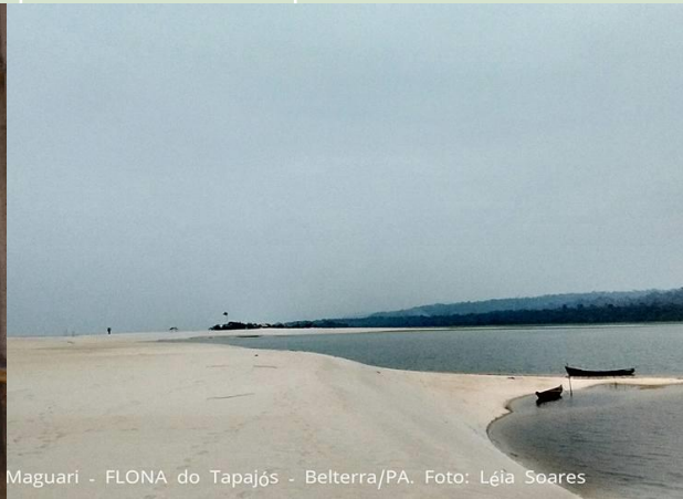
Maguari - FLONA do Tapaj s - Belterra/PA. Foto: L ia Soares