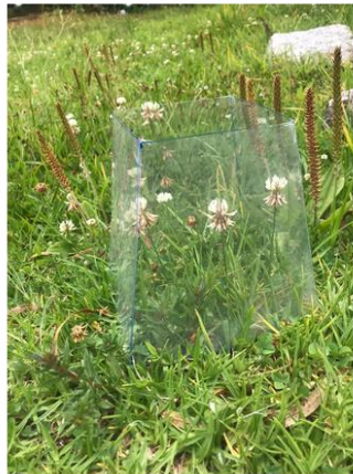
Câmara de acetato de 15 cm (base) x 15 cm (altura) x 10 cm (topo) posicionada em indivíduos de T. repens .

Além disso, foram feitos testes de posicionamento e dimensões de câmaras de acetato para experimentos de indução de aumento de temperatura in situ que serão realizados posteriormente.