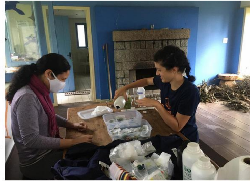
Processamento de material em campo, com secagem das amostras em silicagel.

Além disso, foram feitos testes de posicionamento e dimensões de câmaras de acetato para experimentos de indução de aumento de temperatura in situ que serão realizados posteriormente.