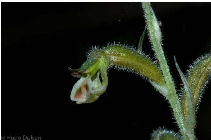
Orchidaceae- Stigmatosema polyaden