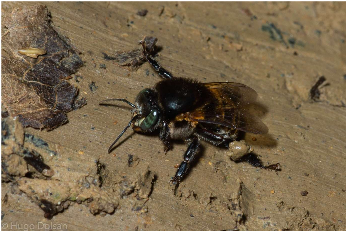
Possível Melipolonia manduri , Melipona marginata , coletando argila nas curbículas.