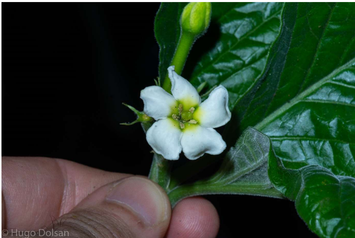
Rubiaceae- Randia itatiae