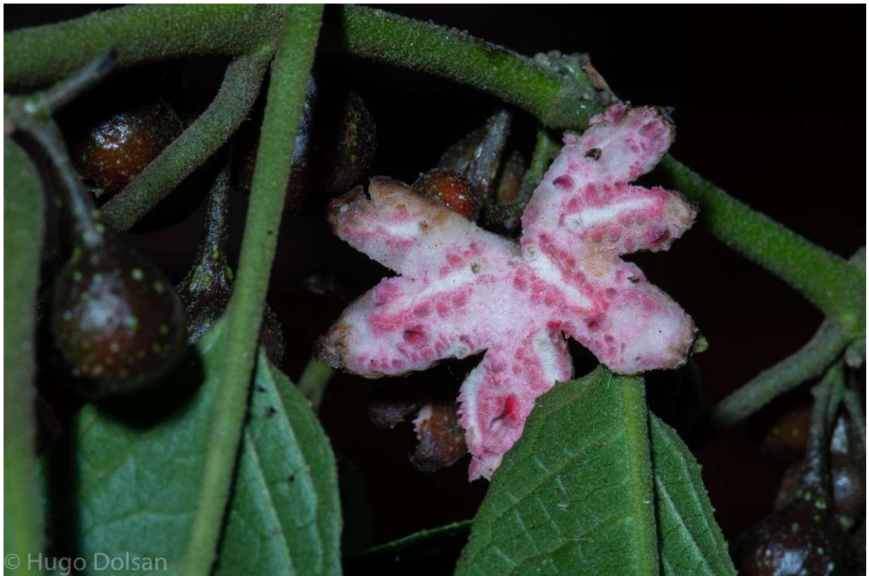
Monimiaceae- Siparuna cf. brasiliensis