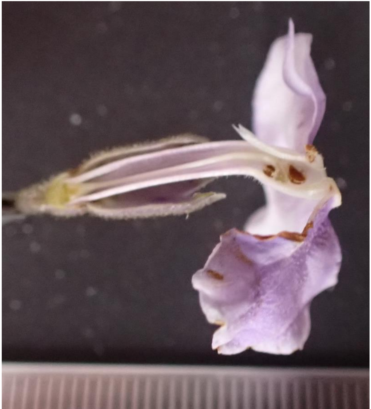
Figura 2. Flores visitadas por duas espécies de beija-flores Phaetornis eurynome (A), Stephanoxis lalandi (B), Heliodoxa rubricauda (C), Exemplo de imagem para morfometria (D)