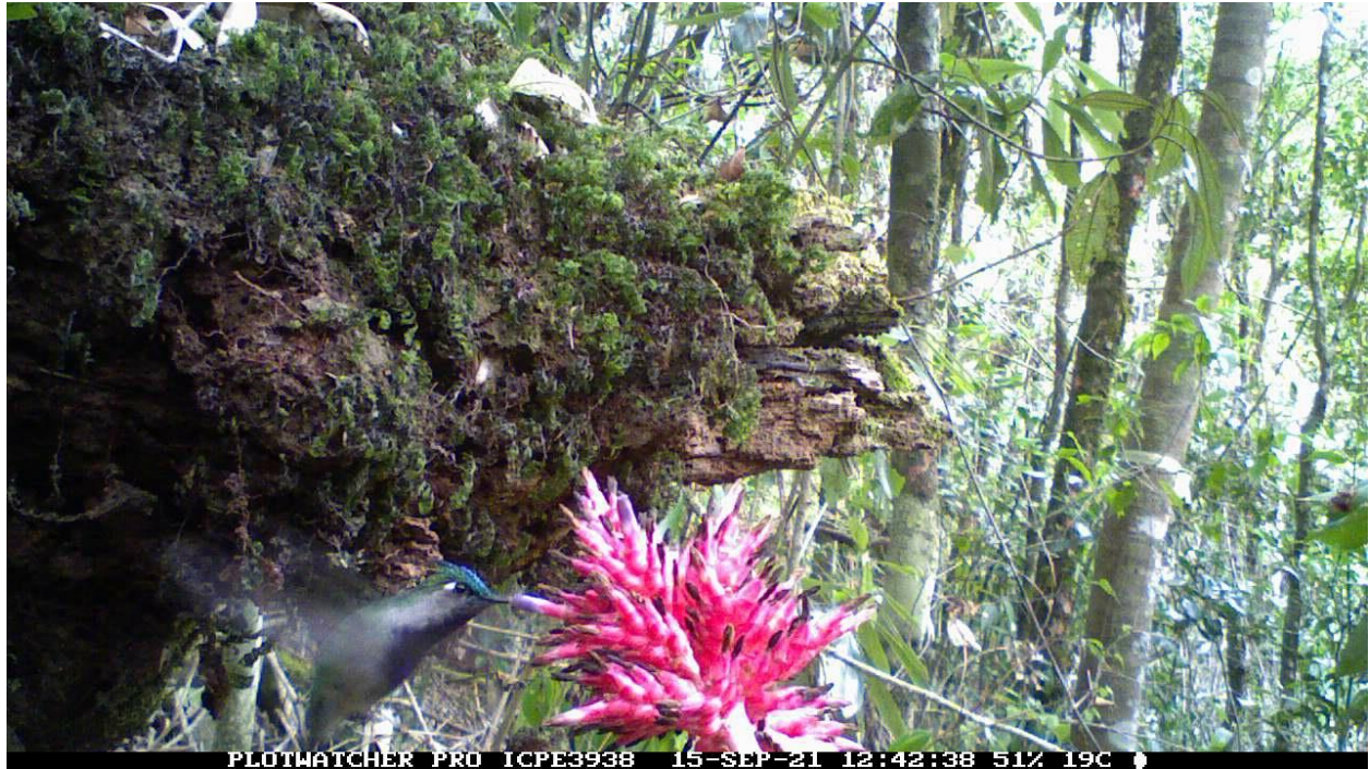
Figura 1 – Procedimentos para obtenção dos registros de interação entre beija-flores e suas fontes de néctar. A –Posicionamento das câmeras em frente às flores; B – Registro de interação entre beija-flor e planta obtido através das câmeras fotográficas.