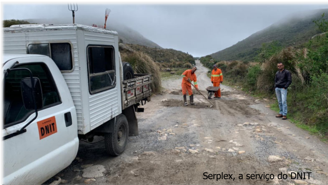
Serplex, a serviço do DNIT

Empresa SERPLEX Engenharia Ltda que, juntamente com a Prefeitura de Itamonte-MG , realizam a manutenção da rodovia BR-485 que dá acesso à Parte Alta do PNI (Aguas Negras & outros atrativos). Grato aos parceiros!!!