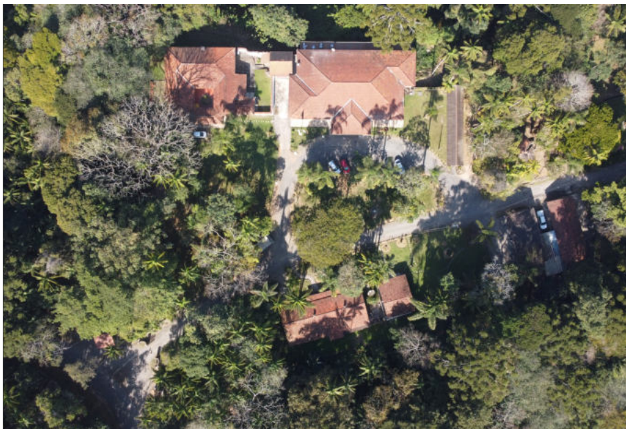
Foto aérea da Sede do PNI (Parte Baixa em Itatiaia-RJ), antiga Fazenda Mont Serrat de 1908, uma das 7 fazendas que em 1937 deram origem ao primeiro parque nacional brasileiro, através de decreto do então presidente Getúlio Vargas.

Além de Itatiaia-RJ, o Parque abrange terras em Resende-RJ, Bocaina de Minas-MG e Itamonte-MG.