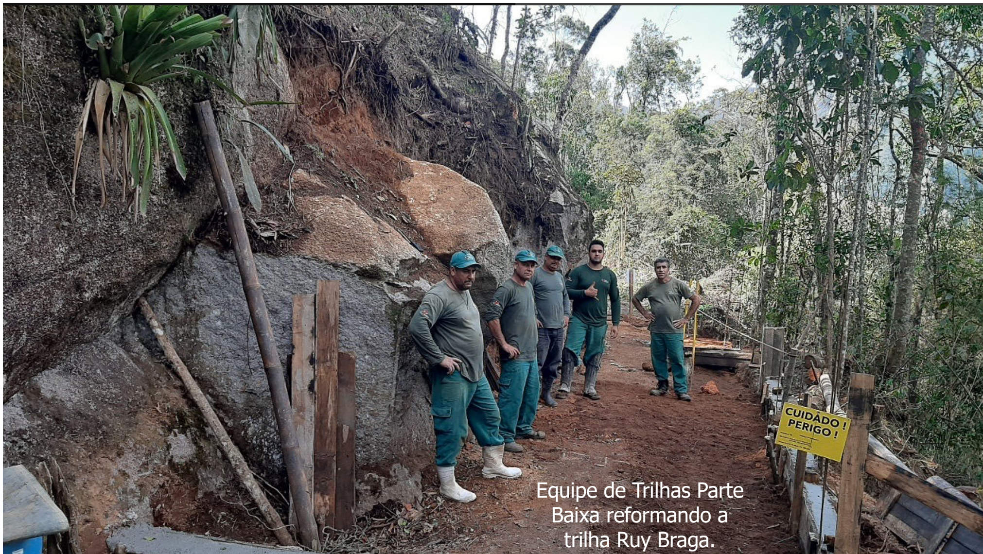
Equipe de Trilhas Parte Baixa reformando a trilha Ruy Braga.