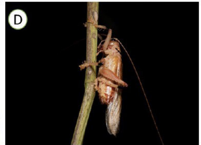
Figura 1: Diversidade de ortópteros do Parque Nacional do Itatiaia. A, grilos do gênero Eidmanacris (Phalangopsidae); B, grilo do gênero Laranda (Phalangopsidae); esperança da subfamília Pseudophyllinae (Tettigoniidae); D, espécime da família Gryllacrididae .