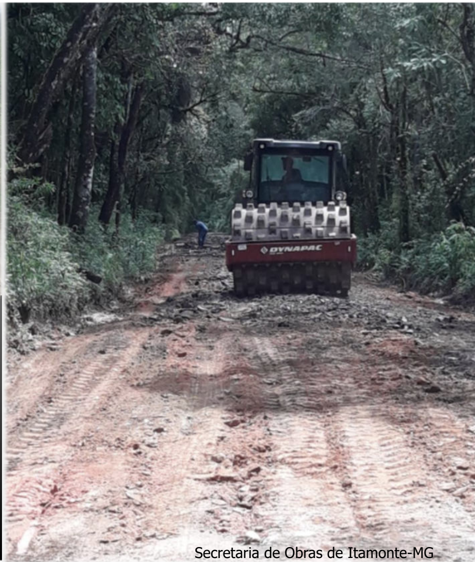
Secretaria de Obras de Itamonte-MG

Empresa SERPLEX Engenharia Ltda que, juntamente com a Prefeitura de Itamonte-MG , realizam a manutenção da rodovia BR-485 que dá acesso à Parte Alta do PNI (Aguas Negras & outros atrativos). Grato aos parceiros!!!