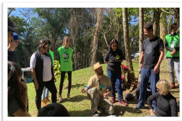
Figuras 1 e 2: Atividades realizadas no dia 21 de julho – #UmDiaNoParque

O Programa de voluntariado do PNI recebeu, em imersão de 8 dias, no período de 18 a 25 de julho, 8 voluntários de regiões diferentes do Brasil, para atuarem nas linhas temáticas de Uso Público & Negócios e Gestão Socioambiental, onde após a capacitação com servidores do PNI, os voluntários atuaram frente aos visitantes no período de férias.