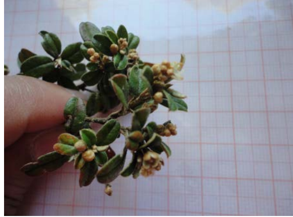
Ramo coletado da espécie Croton dichrous .