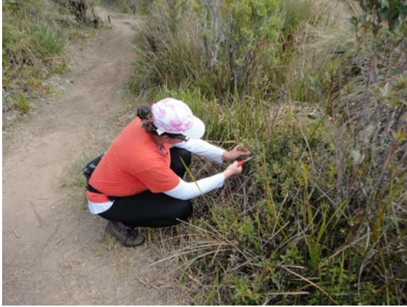
Coleta de material (indivíduo arbustivo).