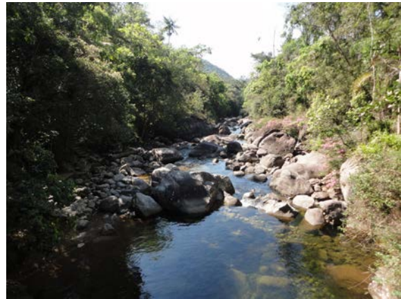
Diversidade de ambientes: Parte baixa do parque.