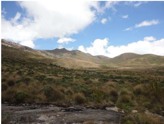
Diversidade de ambientes: Parte alta do parque.