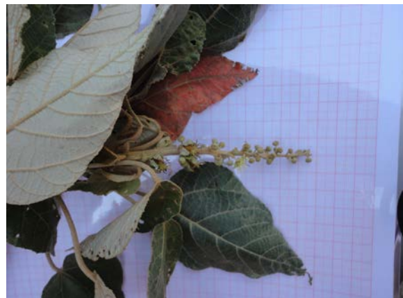
Ramo coletado da espécie Croton alchorneicarpus .