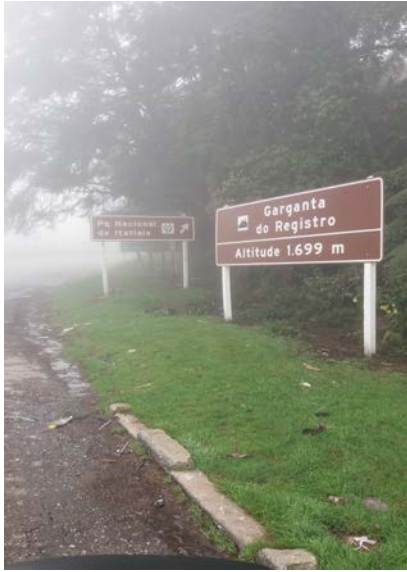
Acesso à parte alta do parque.