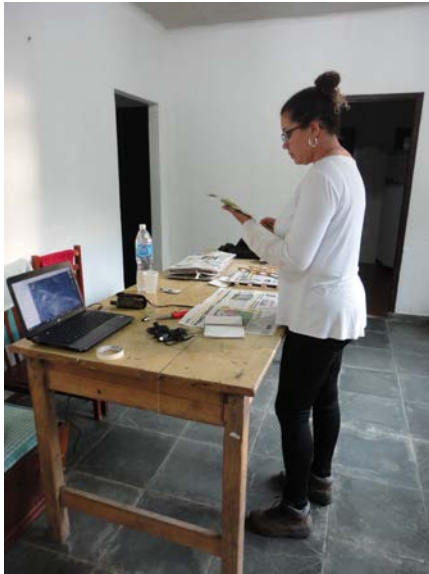
Herborização do material coletado.