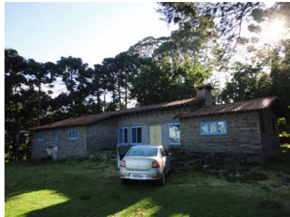
Alojamento Casa de Pedra.