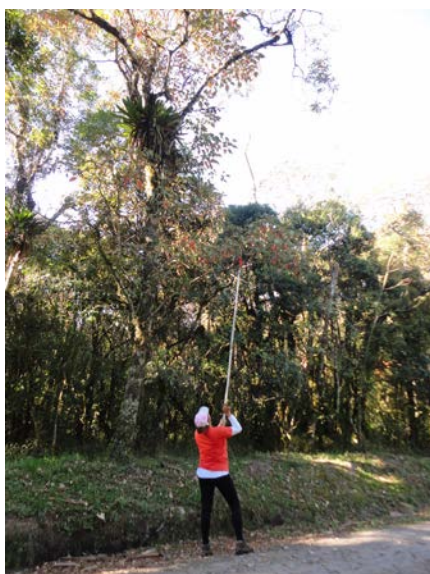
Coleta de material (indivíduo arbóreo).