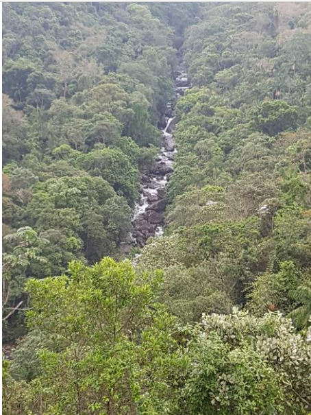
Figura 7 – Aspecto geral do rio Campo Belo, correndo sobre o Maciço de Itatiaia.