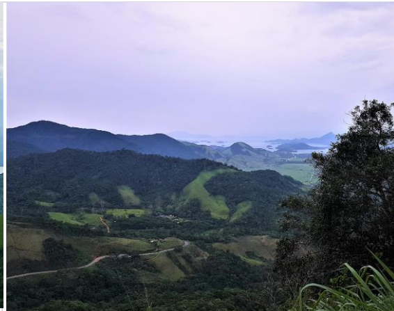
Figura 2 – Transição entre as baixadas litorâneas e a escarpa da Serra da Bocaina.