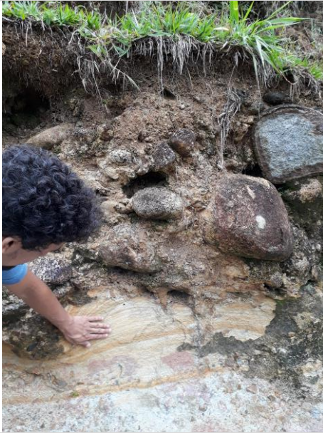
Figura 5 – Detalhe dos sedimentos da Bacia de Resende citados na figura 4.