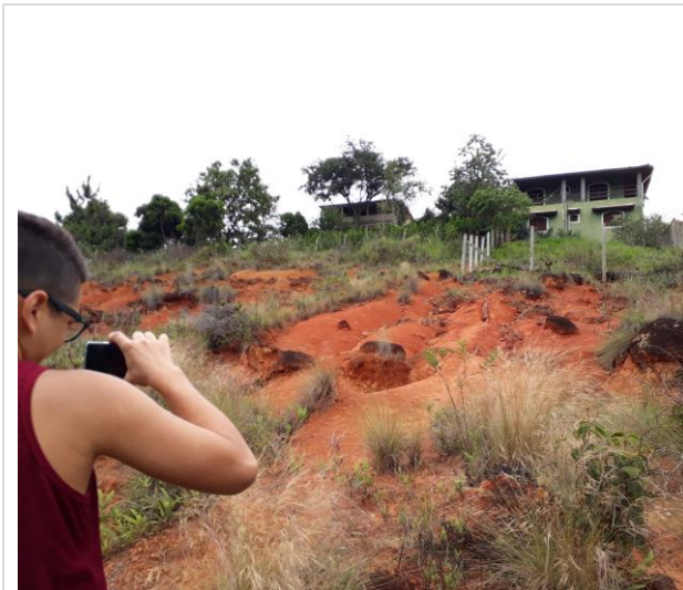
Figura 3 – Encosta afetada por processos hidro-erosivos no bairro Vila Pinheiro, Itatiaia.