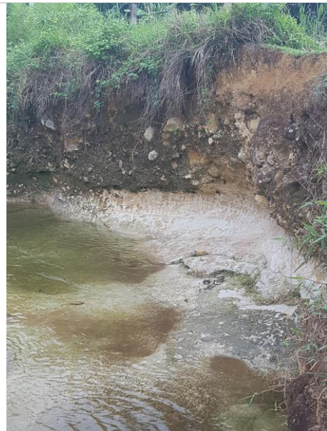
Figura 4 – Erosão fluvial do rio Campo Belo, cortando rochas da Bacia de Resende (conglomerado sobre arenito arcoseano).