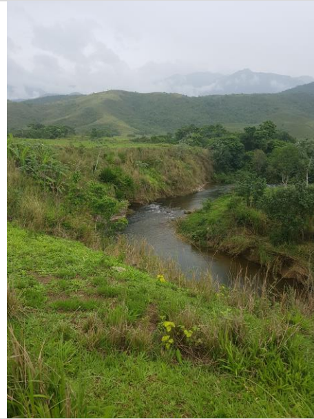
Figura 6 – Aspecto geral do rio Campo Belo, correndo sobre a Bacia Sedimentar de Resende.