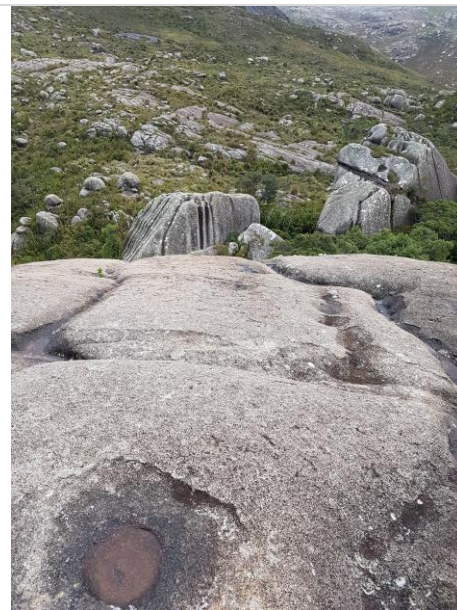
Figura 10 – Aspecto das feições resultantes da dissolução físico-química das rochas do Maciço do Itatiaia.