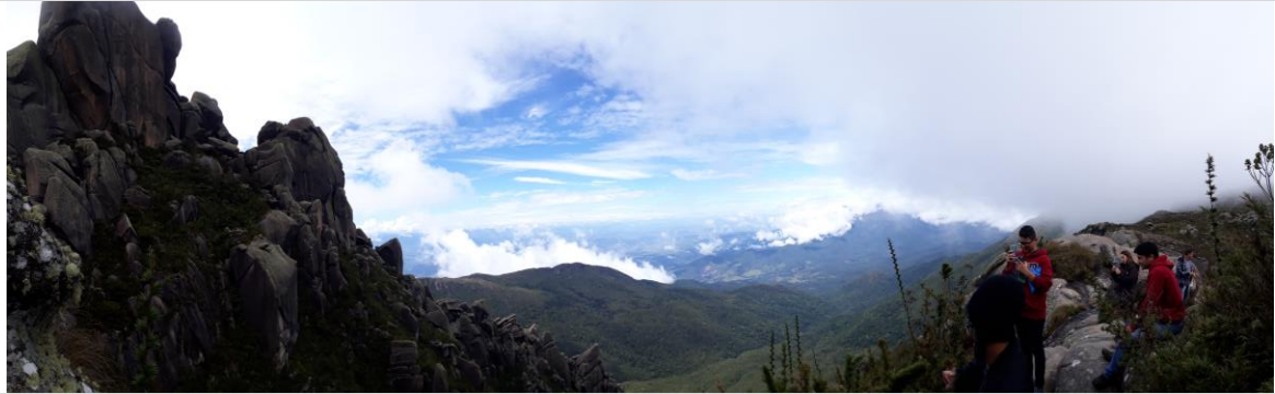
Figura 9 – Vista do Vale do Rio Paraíba do Sul a partir da base das Prateleiras, no Planalto do Itatiaia, PNI.