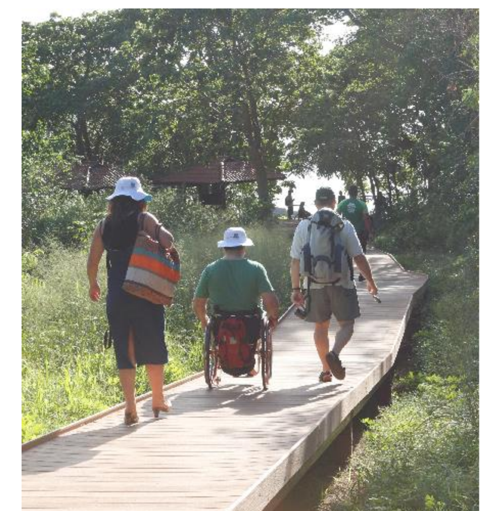
Trilhas com acessibilidade no Parque.