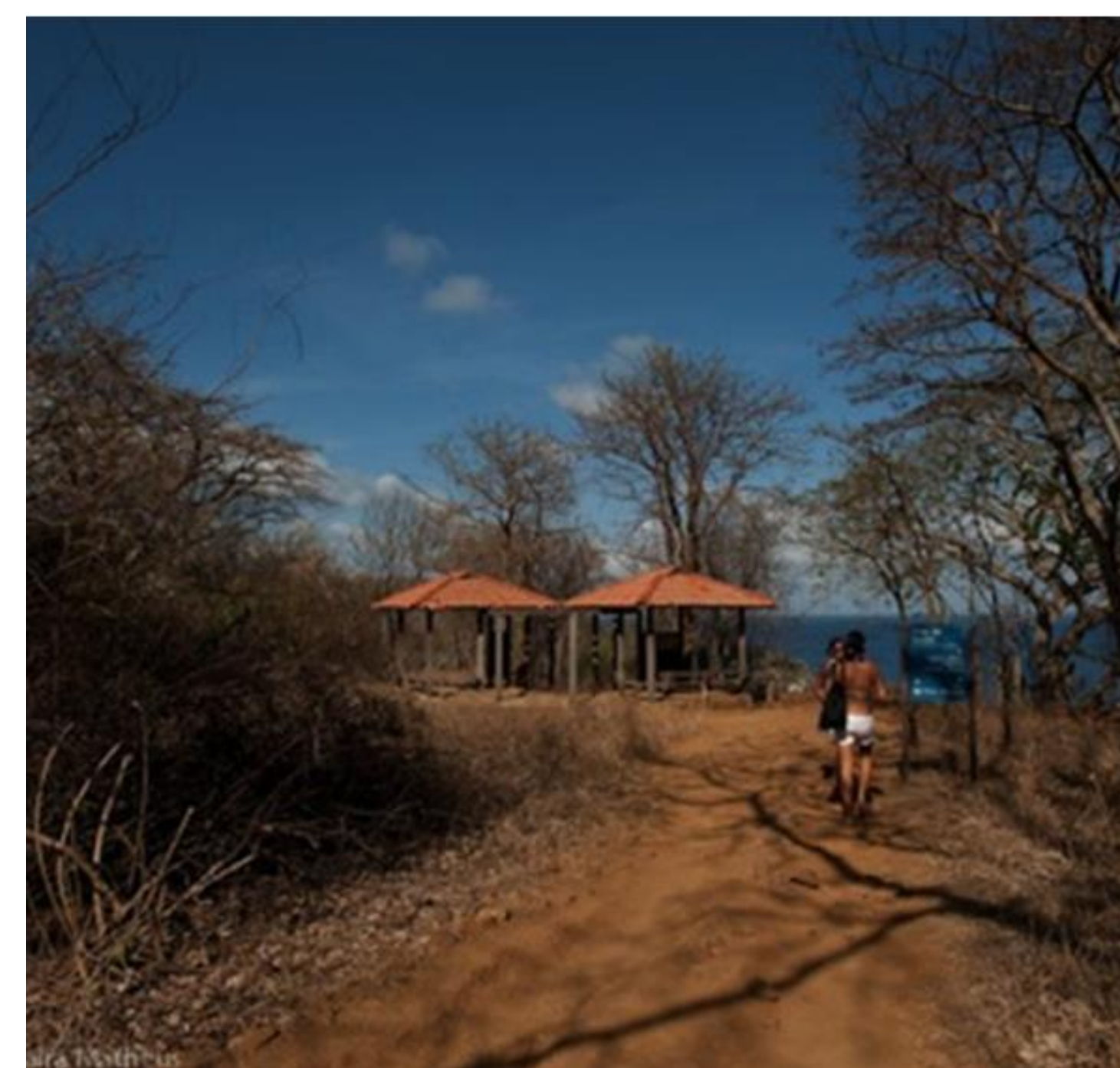
Trilha do Sancho ANTES.

Recebemos no último ano um prêmio nacional de acessibilidade e um título internacional de melhor praia do mundo para se visitar.