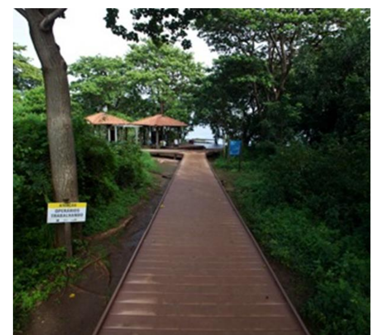
Trilha do Sancho DEPOIS.