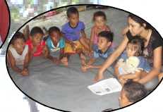
Fotos – Oficinas infantis paralelas ao Projeto "Jovens Protagonistas da RESEX Marinha de Soure" (2013-14)

Ações de comunicação, como a criação de um informativo da UC e de monitoramento da biodiversidade (fase de planejamento) - monitoramento do lixo fluviomarinho, do caranguejo-uça, pesqueiro comunitário e de encalhes nas praias – também prevê a participação do voluntariado. Toda essa gama de ações/projetos acaba constituindo um rico cenário de oportunidades (extensão e pesquisa) para os universitários, e por conseguinte parcerias para gestão da UC. No início do ano de 2014 um novo período de inscrição de